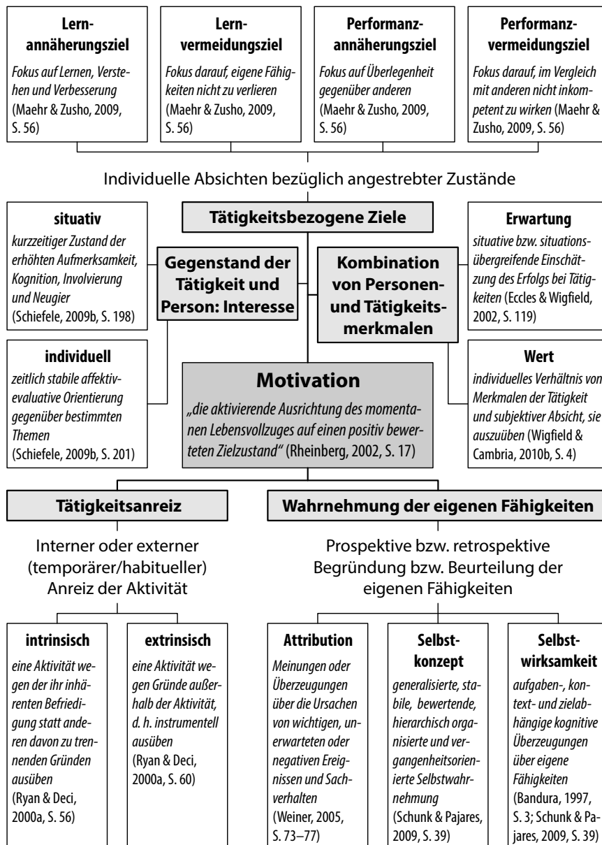
Abbildung 1: Überblick über zentrale motivationale Konstrukte in der Lese- und Schreibmotivationsforschung (Quelle: Philipp, 2013, S. 34, leicht modifiziert)

Die Forschung zur Motivation kennt eine große Zahl von unterschiedlichen, zum Teil miteinander verwandten Theorien und Theoriefamilien, die entsprechend auch erforscht werden. Dies führt dazu, dass es nicht nur verschiedene Zugänge zum Gegenstandsbereich Motivation gibt, sondern auch zu einer großen Unübersichtlichkeit. Deshalb sollen zunächst erst einmal die zentralen theoretischen Konstrukte geklärt werden. Diese sind in Abbildung 1 dargestellt.