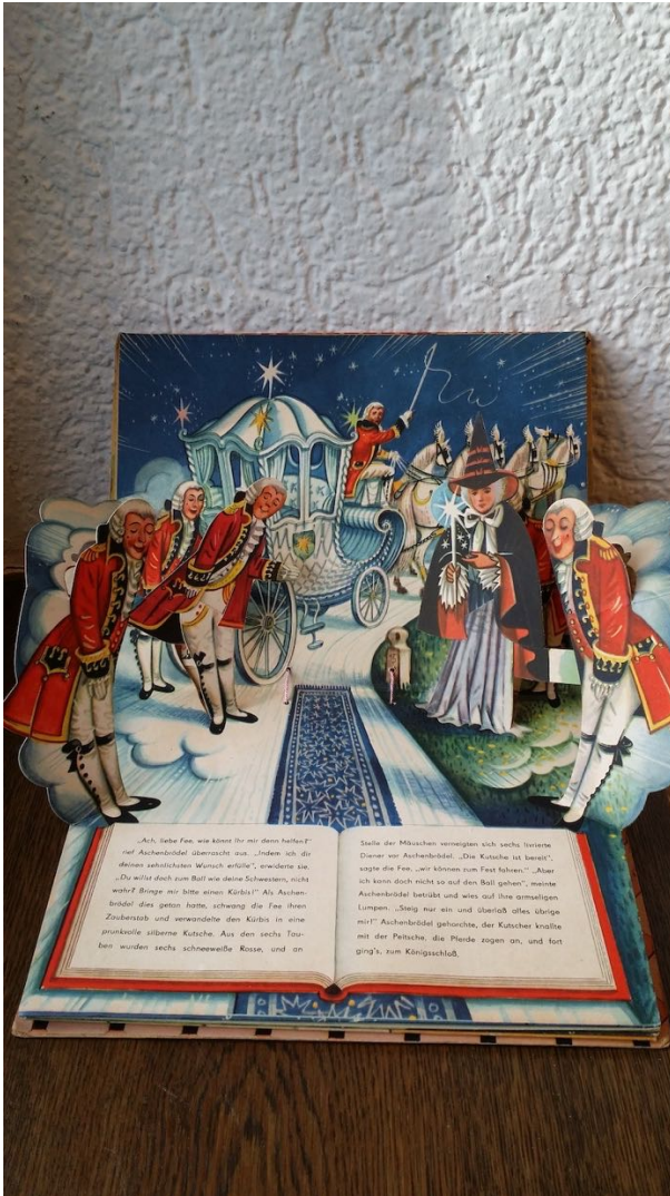
Abb 1: Kubasta Cinderella Szene

Der Inszenierungseinfall des flüchtig-bildlich dargestellten Buchs im Buch hat unter anderem den Vorteil, dass sich auf diese Weise hinreichend viel Platz für ganze Textabsätze ergibt, der Text also einen eigenen – und nicht zu kleinen – Raum zugewiesen bekommt. Die Text-Elemente stehen dabei weder verbindungslos neben den Papierskulpturen, noch rivalisieren sie mit den bildhaften Elementen um die Aufmerksamkeit der Nutzer. Vielmehr sind sie auf eine oszillatorische Weise in Bildszenen integriert – einerseits als Darstellungsmedien, andererseits als ein intradiegetisches Stück Wirklichkeit unter anderen. In Kubašta Pop-up-Räumen selbst liegt, anders gesagt, das Buch einerseits stets innerhalb des dargestellten Märchenwelt-Raums, und es präsentiert andererseits auf den jeweils aufgeschlagenen Doppelseiten den Text als autonome Kompositionseinheit – vergleichbar mit einem Textbuch oder Libretto, das man parallel zu einer Bühnenaufführung liest. Nicht allein, dass sich ganze Texte so einerseits distinkt, andererseits harmonisch in die Konstruktion einfügen lassen; ihre Platzierung im Rahmen des abgebildeten Buchs erleichtert auch die Produktion von Übersetzungen. Muss dabei doch nur ein Teil der Gesamtkonstruktion geändert werden (an die Stelle des tschechischen Textes tritt der französische, deutsche, englische etc.), ohne dass die szenische Umgebung der abgebildeten Bücher davon betroffen wäre.