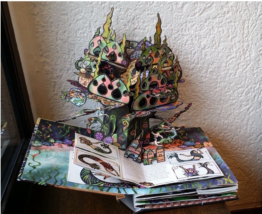
Abb. 4 Sabuda Mermaid 1

Entfaltung bringen, die zum anderen aber auch als Bestandteile der intradiegetischen Welt interpretiert werden können – als Takelage eines Schiffs oder als Spannvorrichtungen eines Baldachins.