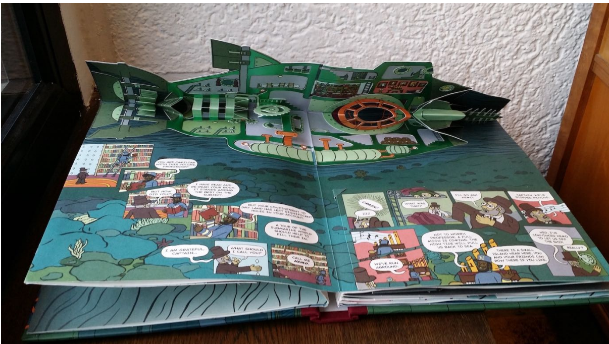
Abb 6 Ita 20000 Leagues 1

Der Textanteil des Buchs besteht ausschliesslich aus diesen in Sprechblasen gesetzten Äusserungen der Comic-Figuren; auf narrative Passagen, Bildlegenden oder Anleitungen für die Nutzer verzichtet Ita konsequent. Ein wenig erinnert das Pop-up-Buch an Dramatisierungen von Romanen, wie sie im 19. Jahrhundert beliebt waren, auch anlässlich von Jules Vernes Romanen. Die Sprechblasen in ihrer Biagsamkeit und Omnipräsenz erscheinen als die wichtigste Manifestationsform der menschlichen Akteure und als die eigentlichen Antagonisten der fremdartigen Meereswelt: des (stummen) Kraken, der wuchernden Korallen, der dunkelgrünen Tiefen der See. Ein Netz von Redebeiträgen, von Dialogen und Monologen, überzieht die Welt der Reisenden und Tiefseeforscher. Selbst ein auf der ersten Doppelseite sichtbarer Brief, der die Ausgangssituation des Abenteurers umreisst, wird von Professor Ardonnax laut verlesen und so gleichfalls in Figurenrede übersetzt.