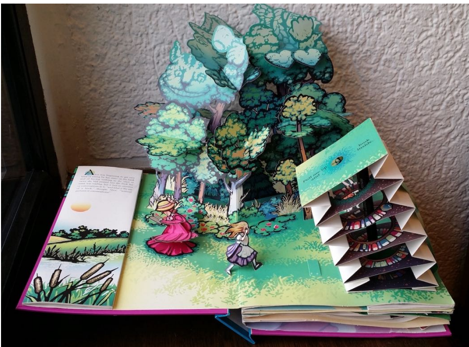
Abb 5 Sabuda Alice 2

Sabuda liegt viel daran, in seinem Pop-up auch Bücher als Bücher zu inszenieren, dass er teils sogar zweistufige Buch-im-Buch-Konstruktionen schafft. Öffnet man das erste Pop-up, so erhebt sich als Pop-up-Konstruktion ein kompliziertes Gebilde aus pflanzlichen Elementen und zahlreichen Nixenwesen, das die Unterwasserwelt darstellt. Auf die rechte Doppelseitenhälfte ist ein kleines Buch montiert. Durchblättern dieses, so wird der Text der Erzählung sichtbar – aber auch weitere kleine Pop-ups, die in dieses Buch integriert sind (also Bücher-im-Buch-im-Buch). Auf den Minibuchseiten finden sich dann erneut weitere bucharartige Klappkonstruktionen mit Mini-Pop-ups im Inneren (also Pop-ups im Buch im Buch im Pop-up). Und so verschachteln sie die Räume des Buchs und der Märchenwelt ineinander, das eine jeweils der Behälter des anderen.