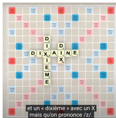
Exemple 2 : mais un dixième qui s'écrit avec un x et se prononce /z/, vidéo la faute à l'orthographe ©

FE : Les objectifs visés sont-ils différents en fonction du mode de communication adopté ?