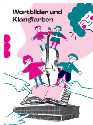
Abbildung 6 Kartendesign seit 2023 ©PAPINESKA

Der Informationstext auf der Karte fasst das Veranstaltungskonzept hinter Wortbilder und Klangfarben perfekt in Worte: