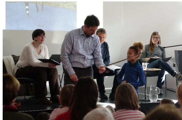
Abbildung 8 Kennenlernen des Instruments Violine im Anschluss an die Lesung

Diese passgenaue Auswahl erschafft eine ganz besondere Atmosphäre und hilft den Kindern im Publikum, schnell eine emotionale Verbindung zu den Figuren im Buch aufzubauen und zu vertiefen.