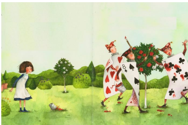
Abbildung 11 Auszug aus dem erstellten Bilderbuchkino ohne Textpassagen zu „Alice im Wunderland“ ©Annette Betz

Für die Veranstaltung selbst bedarf es eines Bilderbuchkinos. Dieses beinhaltet ausschliesslich die Illustrationen ohne den zugehörigen Vorlesetext. Viele Verlage bieten mittlerweile zu ihren Bilderbüchern ein vorgefertigtes Bilderbuchkino zum Download an. Ist ein solches nicht vorhanden, erstellen wir dieses selbst. Dafür müssen die Seiten des jeweiligen Buchs gescannt und so bearbeitet werden, dass zum Schluss nur die Bildinhalte passend zum gelesenen Text gezeigt werden können (Abb. 11).