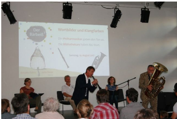
Abbildung 1 Auftaktveranstaltung am 19.08.2017

Am 19. August 2017 konnten Kinder, Eltern, Grosseltern und viele weitere Gäste anlässlich des Tags der Offenen Tür im Kulturpalast Dresden zum ersten Mal das eindrückliche Zusammenspiel von Sprache, Musik und Bildern bei der Auftaktveranstaltung von Wortbilder und Klangfarben erleben (Abb. 1). Mitarbeitende der Zentralbibliothek lasen mit verteilten Rollen das Buch „Der Bärbeiß“ von Annette Pehnt. Musikalisch illustriert wurden die beiden wunderbar gegensätzlichen Figuren – der grummelige Bärbeiß und das fröhliche Tingeli – von einem Tubisten und einem Klarinettenisten der Dresdner Philharmonie (Abb. 2).