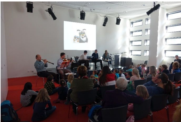
Abbildung 7 „Frühling mit Freund“ mit Violine und Oboe

In diesem Fall sollten die Instrumentalisten jeweils passend zum Text ausgesucht werden. So wurde beispielweise in der Vergangenheit ein Bär durch eine Tuba dargestellt. Da dieser Bär im weiteren Verlauf der Geschichte immer wieder zur Ukulele greift, wurde diese ebenso in die Lesung eingebunden. Für die beiden warmherzigen Figuren im Buch „Frühling mit Freund“ von Annette Herzog kamen die hell und freundlich klingenden Instrumente Violine und Oboe zum Einsatz.