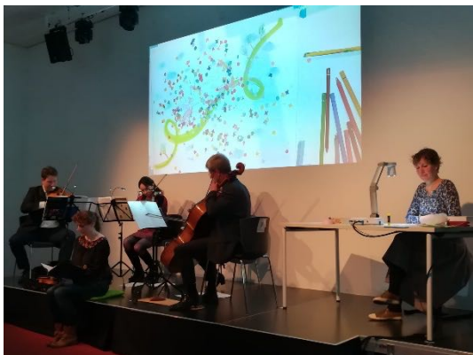
Abbildung 9 Wortbilder und Klangfarben zum Thema Frühling

Jahreszeitentypische Schwerpunkte bieten sich ebenfalls bestens für eine passende Textauswahl an. Wir haben u.a. eine Veranstaltung zum Frühling realisiert. Dafür wurden diverse Gedichte und Kurzgeschichten mit einem Bezug zum Frühling versammelt. Ein Bilderbuchkino gab es bei dieser besonderen Ausgabe von Wortbilder und Klangfarben nicht, da während der Veranstaltung live gezeichnet wurde. Die Bilder, welche die Illustratorin Anja Maria Eisen passend zu Texten und zur Musik schuf, wurden dem Publikum über eine Dokumentenkamera sichtbar gemacht (Abb. 9 und 10).